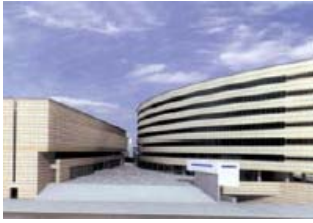
Η μακέτα του νέου κτιρίου της Εθνικής στη Λεωφ. Συγγρού στην Αθήνα

σφαλιστικής. Η Εθνική Ασφαλιστική δίδει έμφαση στη λιανική πώληση (retail) χωρίς να παραγνωρίζει την ανάπτυξη των λοιπών εργασιών της καθώς εκτιμά ότι εκεί βρίσκεται η σημαντική ανάπτυξη. Με βάση τη στρατηγική της Εταιρίας αλλαγές σε όλους σχεδόν τους τομείς δράσης αλλά στις υποδομές της πρόκειται να υλοποιηθούν σύντομα δίνοντας έτσι μια νέα δυναμική στην μελλοντική της πορεία. Τη νέα δυναμική εικόνα της Εθνικής Ασφαλιστικής αναμένεται να «σφραγίσει» και η μετεγκατάστασή της στο νέο ιδιόκτητο ακίνητό της το οποίο βρίσκεται στη Λεωφόρο Συγγρού. Η μετακίνηση αυτή θα έχει ολοκληρωθεί το καλοκαίρι.